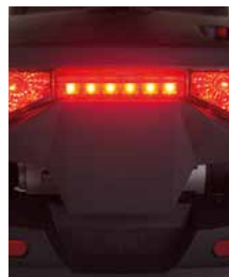
Feux de stop

S'allument automatiquement, lors de la décélération et le freinage.