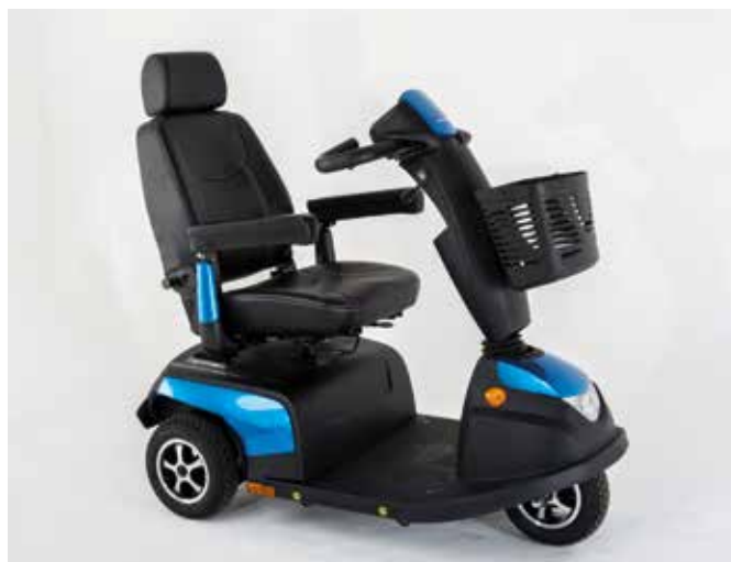
Orion METRO 3 roues