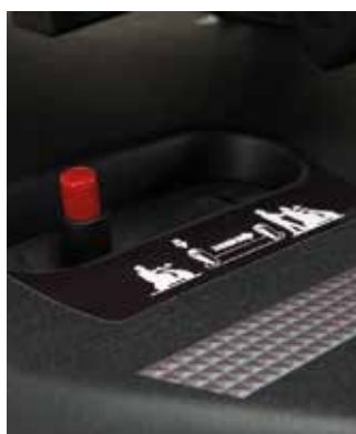
Levier de débrayage en deux étapes

S'allument automatiquement, lors de la décélération et le freinage.