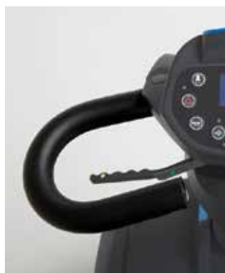
Poignées de direction ergonomiques

Les utilisateurs peuvent facilement régler la colonne de direction en angle grâce au levier.