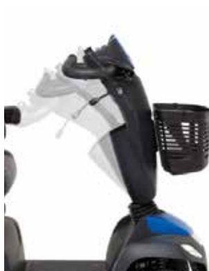
Réglage de la colonne de direction

Les utilisateurs peuvent facilement régler la colonne de direction en angle grâce au levier.