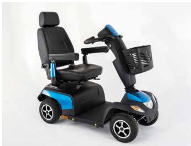
Orion METRO 4 roues