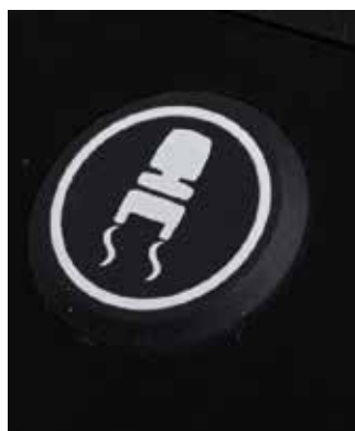
Réducteur de la vitesse automatique

Ce levier empêche le scooter de partir accidentellement en roue libre.